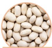
Haricots blancs 0,54 g