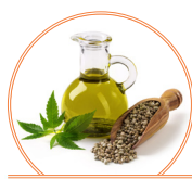
Huile de chanvre 18 g