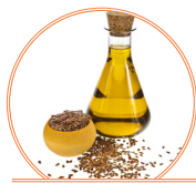
Huile de lin 55 g

Teneur en oméga-3 pour 100 g de quelques aliments et ingrédients courants