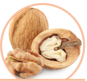
Noix de Grenoble 8 g