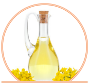
Huile de colza 8 g