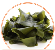
Algue Wakamé 0,22 g

Choisir des sources végétales d'oméga-3, c'est aussi préserver les écosystèmes marins et aquatiques en général, en ne contribuant pas à la surpêche ou à l'aquaculture. C'est aussi éviter la consommation d'animaux dont la chair contient souvent d'importantes quantités de polluants (métaux lourds, résidus de pesticides, etc.).