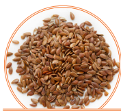
Graines de lin 22 g