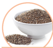
Graines de chia 18 g